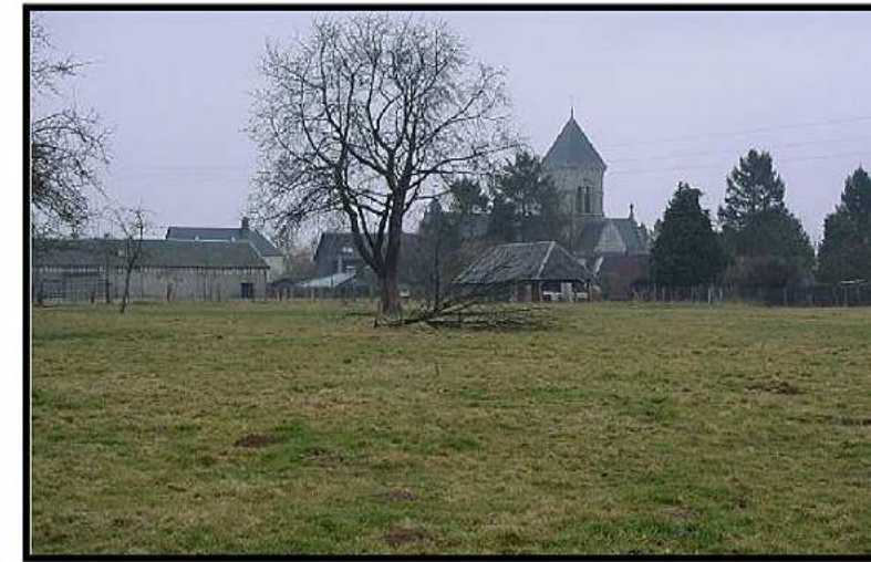
Etat actuel du site