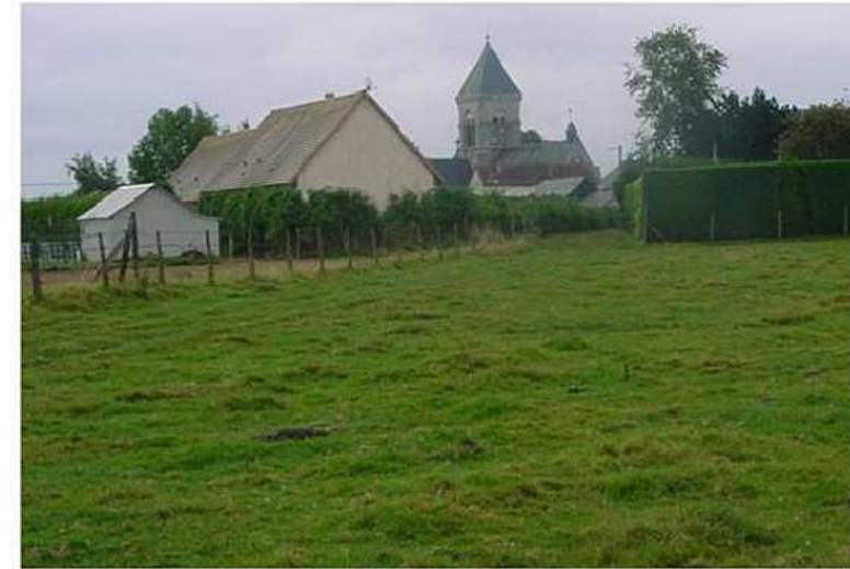
Etat actuel du site